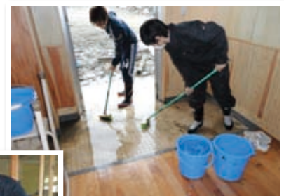
気仙沼市立鹿折小学校にて